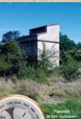
Pigeonnier de type «toulousain»